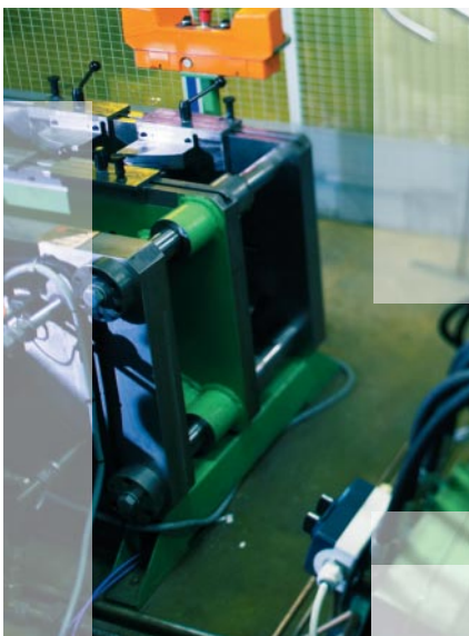
■ High-tech robots lassen de metalen structuren aan elkaar