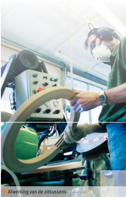
■ Afwerking van de zitkussens