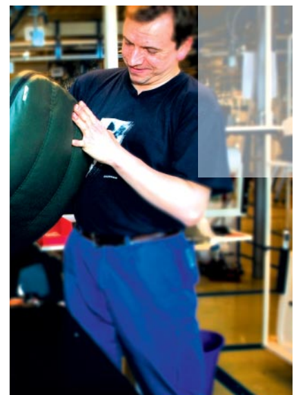
■ Afwerking van de zitkussens