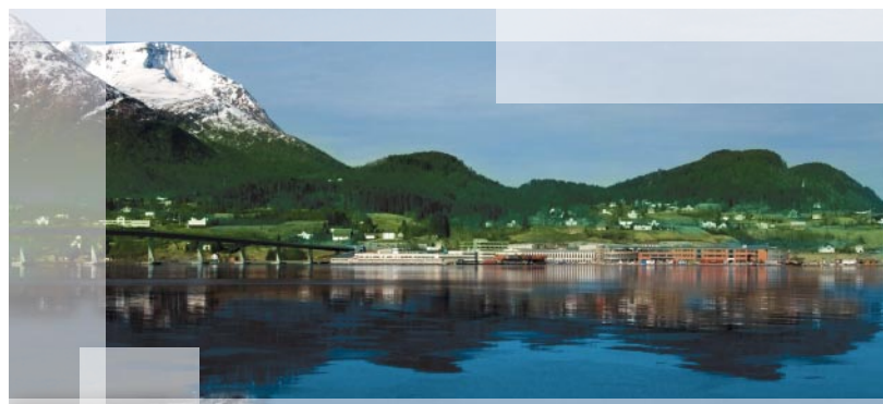
De productie van al onze modellen gebeurt uitsluitend in onze fabrieken in Noorwegen. (Illustratie : Fabriek van Sykkylven)